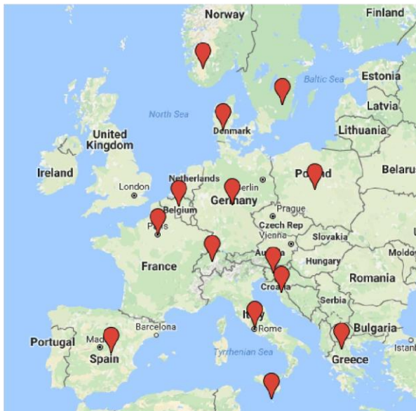
Geographical distribution of FEBEA members. Google Maps